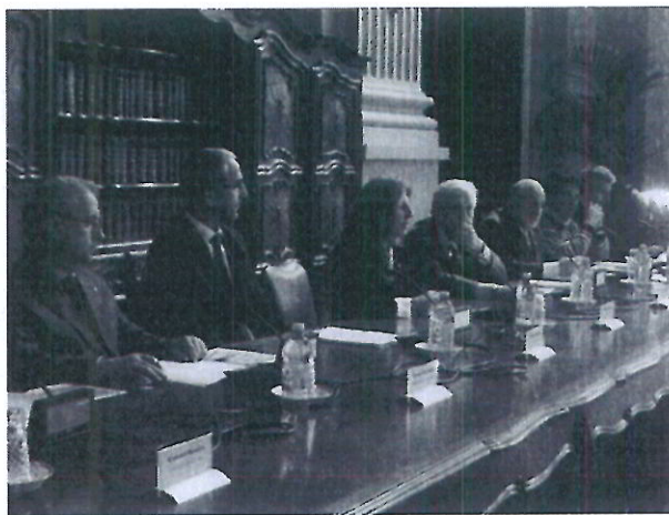
La presentazione in Prefettura

Ad ottobre Cuneo ospiterà il Forum di Greenaccord. Tema dell'edizione: il rapporto tra informazione, democrazia e sostenibilità